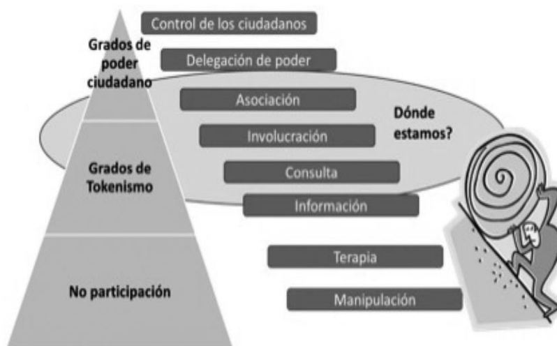
Grados de participación ciudadana