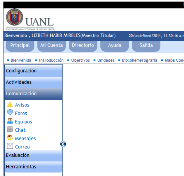
Figura2. Herramientas de comunicación plataforma NEXUS

En el cuarto apartado aparecen varias opciones, de las cuales se utilizaba la calificación basada en estadísticas, la cual no es una prioridad para el tutor, en este apartado se puede observar el total de estudiantes que se encuentran participando y el cumplimiento o no de sus actividades de seguimiento y reportes hacia el tutor.