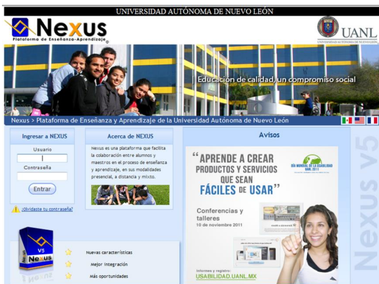
Figura1. Página de inicio plataforma NEXUS (www.nexus.uanl.mx)

Es por lo anterior que se implemento la tutoría por medio del uso de la plataforma NEXUS, para realizar la entrega de reportes, compartir sus puntos de vista en los foros de discusión, conversaciones en tiempo real por medio de chats, evaluación de reportes, cumplimiento, entre otros beneficios. Lo cual detallaremos a continuación: